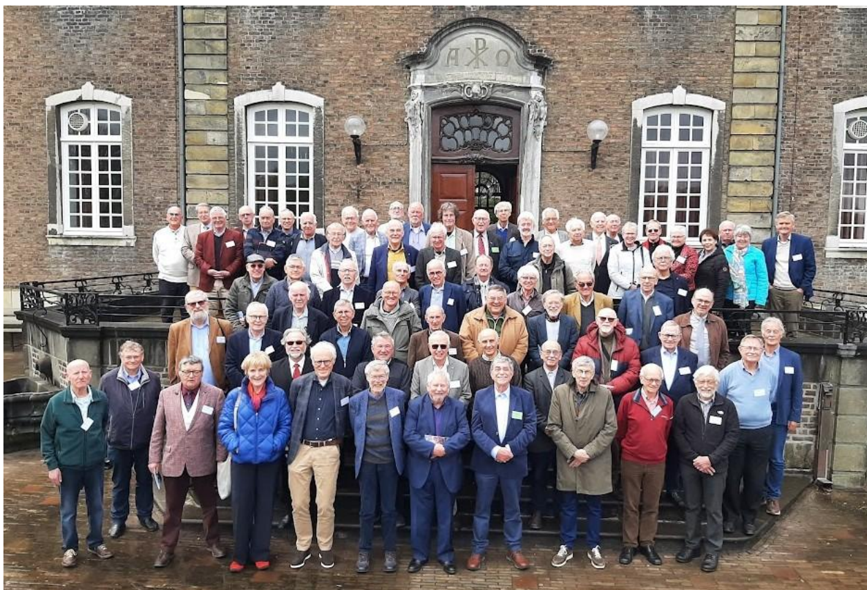
Beide foto's in dit artikel zijn tijdens de reünie in 2024 gemaakt door oud-Rolducien Pierre Snijders