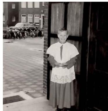
(op Rolduc van 1962-1969)

Ik kijk overigens met plezier terug op mijn periode op Rolduc, hoewel ik met de bril van nu op zeker ook zaken heb gemist, zoals huiselijke warmte, persoonlijke aandacht en een onbevangen jeugd in een meer natuurlijke omgeving. Het was voor mij hard studeren om bij te kunnen benen; de verplichte studies (3 per dag !) hebben me zeker geholpen.