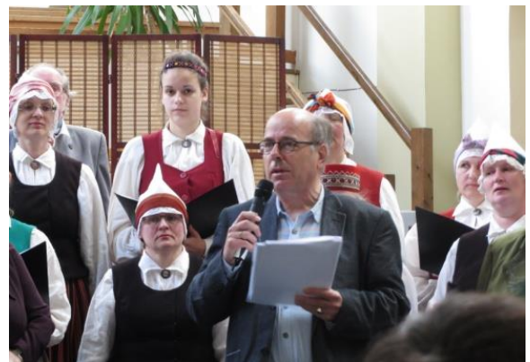
Met een Lets koor in Venlo in 2014