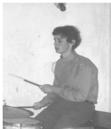
The Sophisticated Movement