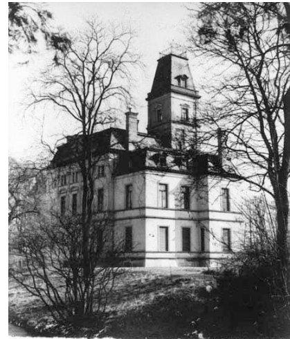
Villa Kanjel aan de Meersenerweg