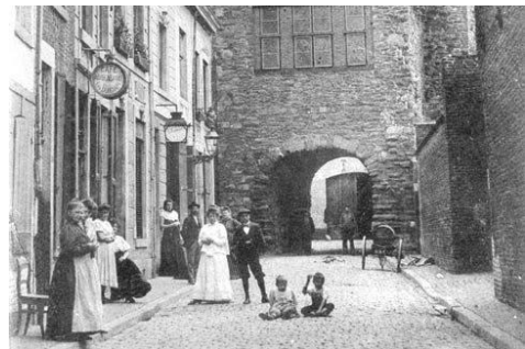
Helstraat met zicht op Heloort circa 1905