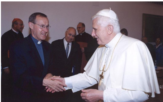
Hub Schnackers geeft toenmalig paus Benedictus XVI een hand.

Op 31 december 2022 overleed in Rome de vorige paus Benedictus XVI.