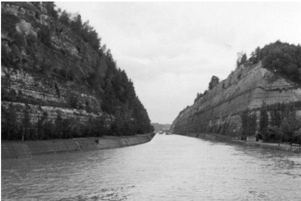
Vertier op de lange bootreis al varend door de Flessenhals van Ternaaien

Het is op 4 oktober 1967 niet alleen werelddierendag, maar ook de feestdag van de heilige Antonius. De naburige HBS is naar hem vernoemd. Omdat steeds meer interne leerlingen daar onderwijs volgen en vandaag dus vrij hebben, is besloten om de jaarlijks te houden schoolexcursie voor de leerlingen van het gymnasium juist op deze dag te plannen. De HBS-ers van Rolduc kunnen daardoor ook mee. Stipt om 8 uur 's ochtends rijden de bussen ons eerst naar Maastricht. Van daar uit vertrekken we een uur later met de plezierboot 'Maasvallei' richting Luik. Met name het passeren van de Sluizen van Ternaaien is een ware belevenis. Door averij van een schip voor ons duurt het bootreisje echter iets langer dan de voorziene drie uur. Voor het programma in Luik is daardoor nog maar twee uur beschikbaar. Persoonlijk herinner ik me van deze dag alleen nog de Montagne de Bueren, een indrukwekkende trap van 374 treden, die de binnenstad met de voormalige citadel verbindt. De terugreis per boot stroomafwaarts naar Maastricht verloopt zonder incidenten. Tegen 19.00 uur rijden op die dag de bussen weer door de poort van Rolduc. Voor het eerst heb ik op deze dag met een eigen eenvoudig fototoestelletje enkele foto's gemaakt.