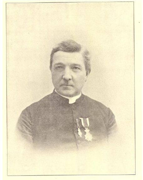
Kanunnik M. Goebbels schilder van de kerk Rolduc

Dezelfde groep bevat nog, in kleinere gestalte de eer der Heiligen mocht aan den stichter niet gegeven worden - het beeld van Ailbertus met de kerk van Rolduc en de woorden: «Eere zij den Vader en den Zoon en den H. Geest.»